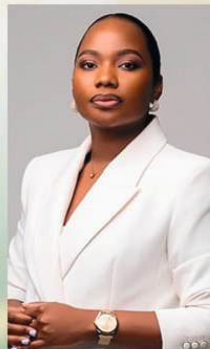
Terapeuta Integrativa Palestrante Facilitadora de Processos de Cura