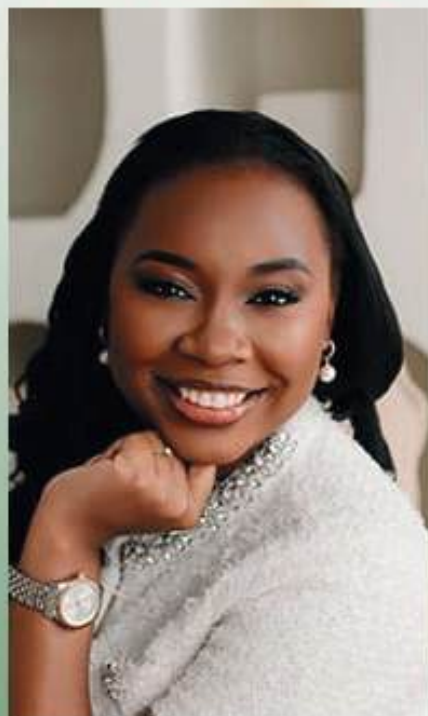
Assessora de Eventos e Cerimonialista