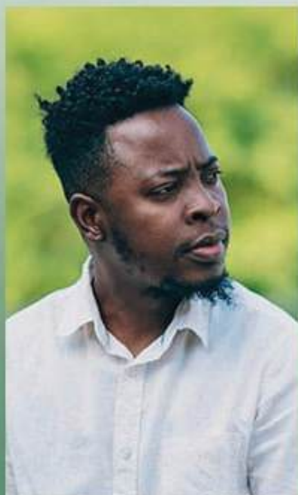
Mentor Espiritual e Médiun