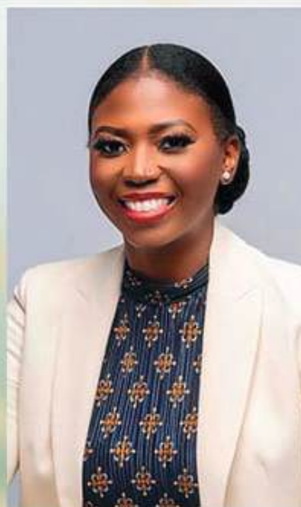
Especialista em ortodontia e periodontia